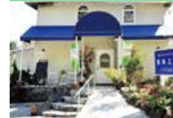
地図 P34 左中

イタリア料理 レガーロ テッラ ランチ 11:30 ~ 15:00 (L.O. 13:30) ディナー 18:00 ~ 22:00 (L.O. 20:30) ディナーは完全予約制。ご予約は当日17:00まで TEL0557-48-7798 木曜日定休 伊東市富戸 1108-35