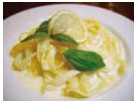
地図 P34 左中

桜のトンネル通りにある南イタリア家庭料理のお店プルチーノで、のんびりとした休日をお過ごし下さい。イタリアワインを豊富に取り揃えております。