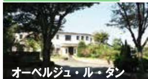
地図 P31 右中