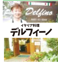
地図 P34 中

定休日 毎週火曜日 営業時間 ランチ 11:00 ~ 16:00 (L.O.) ディナー 17:00 ~ 21:00 (L.O.) 閉店 22:00 伊東市富戸 911-4 TEL0557-51-2244