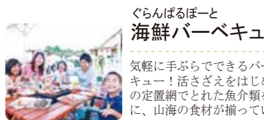
地図 P32 中 Check! P10

海外で修行したパパさんのパスタ・ピザはもちろん、色々なおぼんざい! 地元のリピータさんがいっぱい! 食味工房さん! そんな料理を貸し切りカラオケルームで仲間や家族で! 美味しい、楽しい、リーズナブル! 予約して行けば安心です。