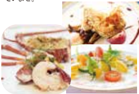
地図 P33 右中

「地産地消」という言葉を掲げ、四半世紀。時の流れと共に進化を続けてきた「伊豆ならではのフレンチ」を心行くまでお楽しみくださいませ。