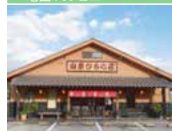
地図 P30 左上

ひものは伊豆のお土産No.1です 山幸ひもの店 伊東市八幡野 1759-750 TEL.0557 (51) 6767 http://www.yamakou-himono.jp 営業時間 AM8:30 ~ PM5:30 定休日 水曜日