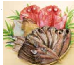
地図 P30 やまもプラザ

店内に所狭しと並ぶ干物は、全て無添加にこだわった、安心・安全なもののみ。塩干しやみりん干し、伊豆近海で獲れた金目鯛・太刀魚たかべ等も人気高い