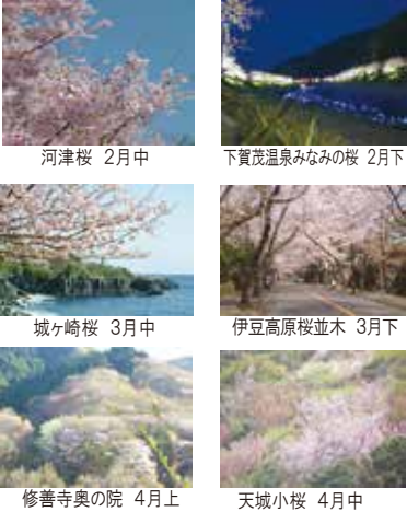
河津桜 2月中 下賀茂温泉みなみの桜 2月下 城ヶ崎桜 3月中 伊豆高原桜並木 3月下 修善寺奥の院 4月上 天城小桜 4月中

伊豆半島はさくら半島。各種早咲きの桜が冬の間に咲くほか、2月の河津桜から本格的な桜シーズンを迎え、一足早い春の雰囲気になります。凛とした空気のなか満開の桜風景は格別です。まだ各地が冬枯れの頃、春の伊豆に足を運んでみてはいかがでしょうか。