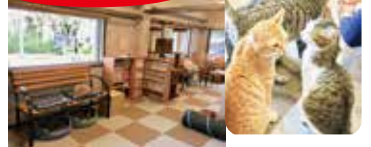
地図 P30 左中