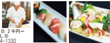
地図 P29 右下

和のオーベルジュ 鮨長 定休日 月・火曜日 営業時間 ランチ 11:30 ~ 14:00 (L.O) 2千円~ ディナー 17:00 ~ 22:00 (L.O) 伊東市川奈 314-1 TEL0557-44-1330