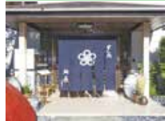
地図 P28 右上

東京赤坂から伊豆川奈へ。美味しい食材と自然のうるおいの中で、一流の和食を提供します。京懐石と江戸前鮨を中心に天然・地魚に拘った和食店。毎朝地元の定置網へ仕入れに行き新鮮な地魚を味わえます。ご予算とお好みをお気軽にお知らせ下さい。伊豆の休日を美食と共にゆっくりお過ごし頂けます。宿泊プランあり。